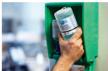
Flaskan tas ut från ögonsköljboxen