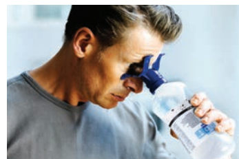
Luta dig eventuellt framåt och skölj om du vill undvika att blöta ned kläderna