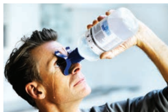
Luta huvudet bakåt och skölj