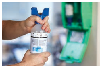
Vrid ögonkoppen tills förseglingen bryts